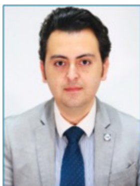
SERGIO MANUEL RAMOS NAVARRO Comisionado Nacional